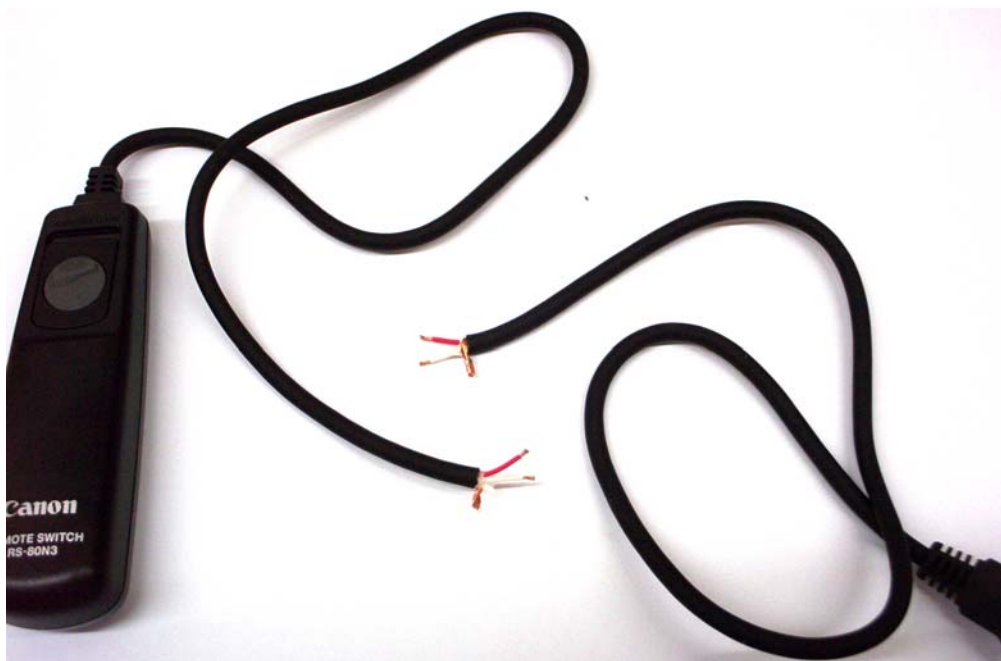
Pelar los extremos e identificar los cables abriendo la botonera. Por norma, la malla es común y Ud. debe localizar el cable de preenfoco.