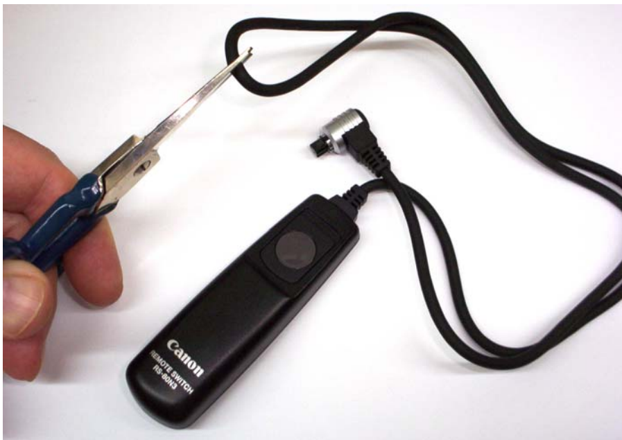
Cortar el cable por la mitad