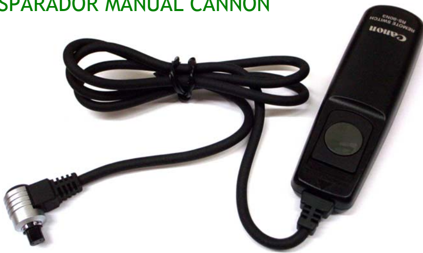
Disparador manual para algunos modelos CANNON EOS